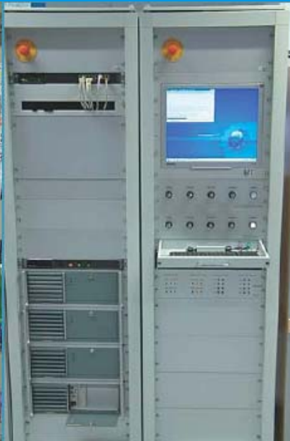
控制柜：网络结构的 C51xx 工控机

同样，EtherCAT 技术的开放性也是一个很突出的优点，它可以与独立于主机的平台。例如，EtherCAT 主机程序是在 Linux 平台下开发，并在项目中得到了很好的应用。TorstenFinke 博士解释道：“主机程序运行在一台配备通用部件的标准工控机上。系统中不需要专用的 PLC，Linux 是个先进的服务器操作系统，并且，已被证明具有良好的稳定性、高效性，尤其是在网络相关的方面。和 RTAI-Linux 内核的实时延伸相结合的开放式构架使得操作系统能够得到硬实时性能，而在程序和服务方面没有什么限制。”