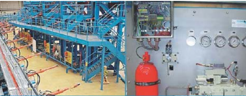
空客高升力系统测试平台